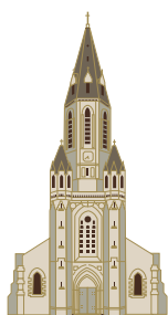
Saint-Antoine-de-Padoue Place Saint-Antoine