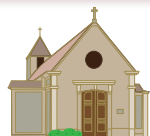
Saint-Germain du Chesnay 27, rue Jean-Louis Forain