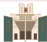
Notre-Dame-de-la-Résurrection 2, avenue du Dr Schweitzer